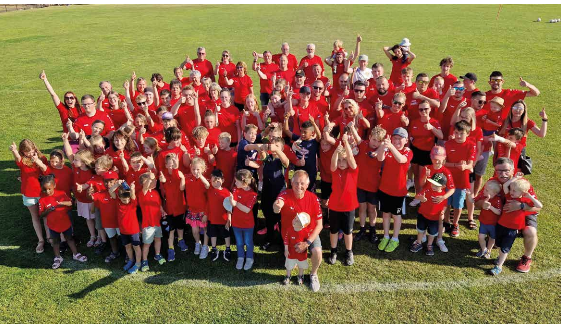
Sportverein Rot-Weiß Germania Wemb