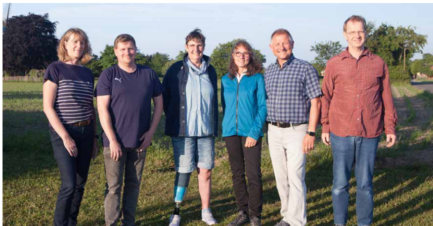
Aktueller Vorstand von „Wir für Wemb e.V.“